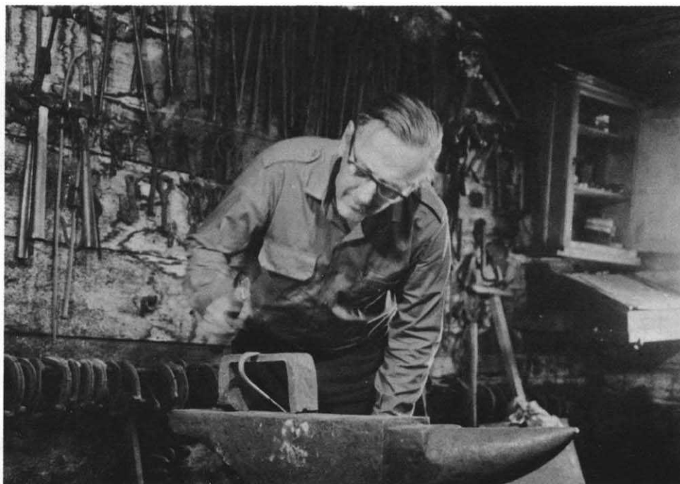
Illustration de l'utilisation de l'étampe en forme de pont.