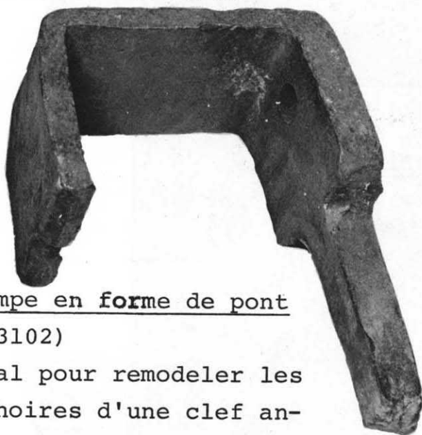
Etampe en forme de pont